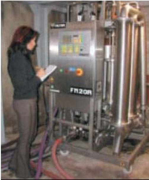
Figura 3 Quattordici prove comparative sono state condotte nel 2001 dalla Inter Rhône.