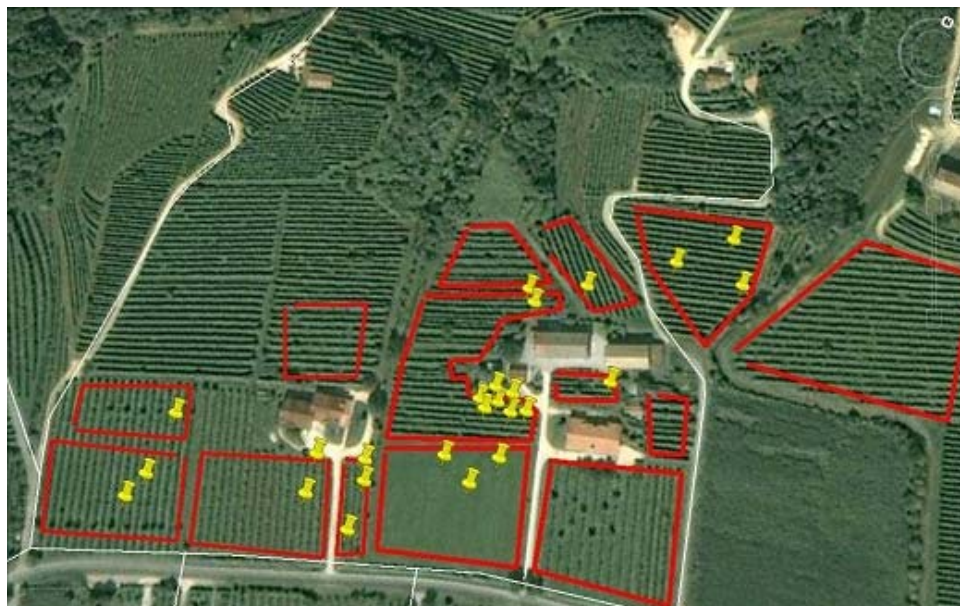
Fig. 5. Esempio della distribuzione delle viti sintomatiche in vigneto. Ogni vite sintomatica è rappresentata dal simbolo giallo. Gli appezzamenti seganti con il bordo rosso sono stati monitorati ceppo per ceppo. In questo caso, come nella maggior parte degli impianti osservati, le piante sintomatiche sono presenti in maniera sporadica e puntiforme.