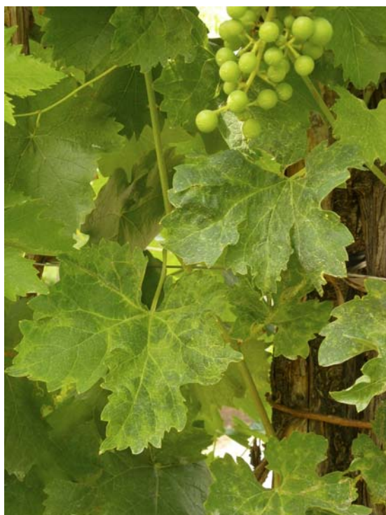
Fig. 1. Sintomi fogliari su cv Glera. Si notano chiaramente le deformazioni fogliari e gli scolorimenti nervali.

I sintomi sono più evidenti all’inizio della stagione vegetativa, anche come ritardo nel germogliamento; sono simili a danni da tripidi e acari o da erbicidi, con deformazioni fogliari, scolorimenti nervali, punteggiature, mosaico e bollosità delle foglie (Fig. 1). I tralci portano internodi più corti, per cui si osserva un aspetto cespuglioso della chioma, che però si attenua con l’avanzare della stagione (Fig. 2).