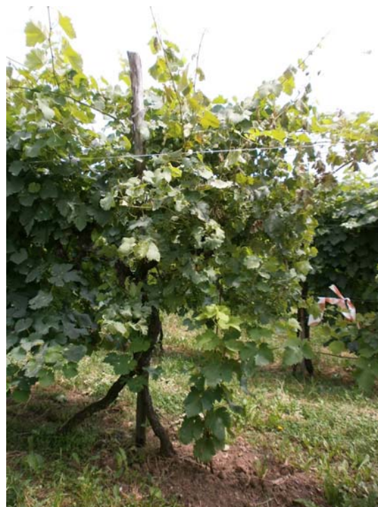
Fig. 2. Aspetto di un vite di cv. Glera colpita dalla malattia nel mese di luglio. L'aspetto cespuglioso della chioma si attenua con l'avanzare della stagione.