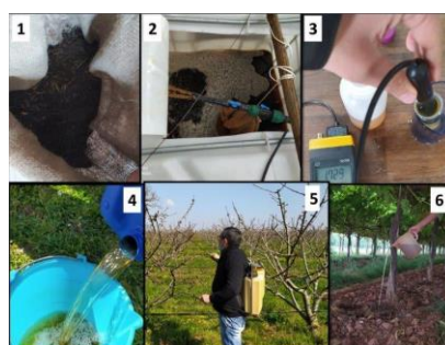
Figura 2. Produzione di compost tea presso l'azienda sperimentale CREA-AA

Il compost tea è un estratto liquido di molecole organiche e inorganiche e microrganismi (fig. 2). Il processo dura solitamente circa 5-8 giorni. Il progetto Oltrebio si è proposto di migliorare la conoscenza della produzione di compost tea e la sua applicazione nei ciliegeti e vigneti biologici in Puglia (fig. 2).