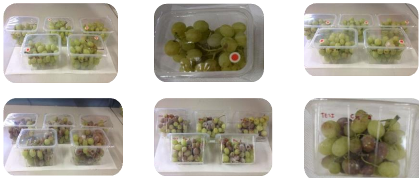
Figura 4. Uva da tavola biologica conservata sotto atmosfera controllata in confezioni dotate del dispositivo BlowDevice®.

La tecnologia BlowDevice®, brevettata da UNIBAS e Ninetek Ltd, conferisce alla confezione caratteristiche di traspirabilità per prolungare la shelf-life della frutta biologica deperibile (fig. 4). Il dispositivo è stato riconosciuto come una 'tecnologia chiave' in Europa. È stata sviluppata una macchina confezionatrice per uso industriale.