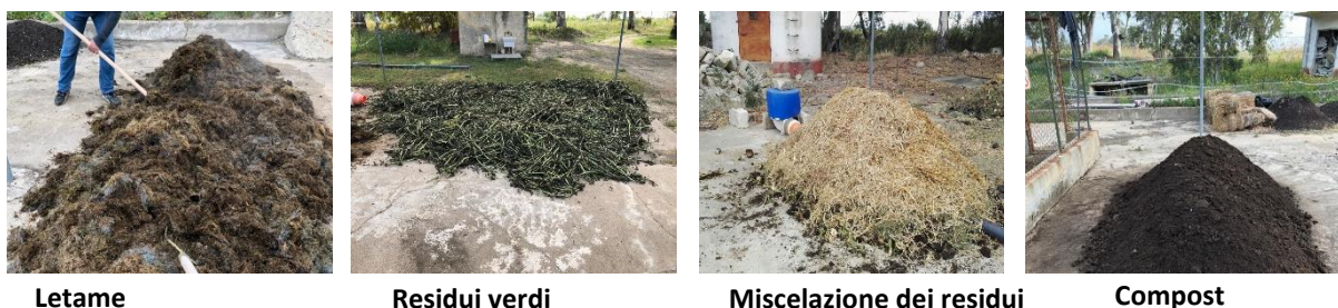
Figura 1. Il compostaggio in azienda presso l'azienda agricola sperimentale CREA-AA

Il compost tea è un estratto liquido di molecole organiche e inorganiche e microrganismi (fig. 2). Il processo dura solitamente circa 5-8 giorni. Il progetto Oltrebio si è proposto di migliorare la conoscenza della produzione di compost tea e la sua applicazione nei ciliegeti e vigneti biologici in Puglia (fig. 2).