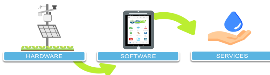
Figura 3: Metodo di comunicazione tra hardware e software

L'OBIETTIVO DEL PRODOTTO È INTEGRARE COMPONENTI HARDWARE E SOFTWARE CON SUPPORTO E SERVIZI AGRONOMICI QUALIFICATI