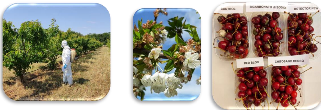
Figura 5. Applicazione del trattamento ed effetto degli estratti naturali per controllare il marciume post-raccolta

Diversi estratti naturali sono stati testati nelle aziende agricole al momento della fioritura e prima della raccolta per controllare l'incidenza del marciume pre- e post-raccolta nelle colture principali. Il chitosano è risultato il prodotto più efficace, riducendo lo sviluppo del marciume di oltre il 68% nelle ciliegie post-raccolta (fig. 5).